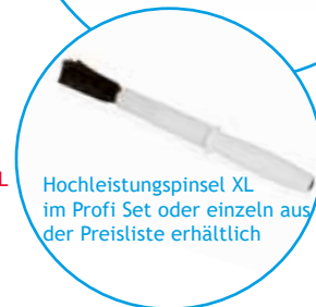
Hochleistungspinsel XL im Profi Set oder einzeln aus der Preisliste erhältlich

Wir bieten zum Brush-IT unseren Hochleistungspinsel XL mit 1.4 Mio. Fasern an.