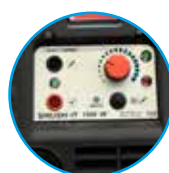
BRUSH IT mit Beschriftungsfunktion