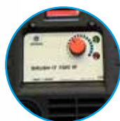
BRUSH IT ohne Beschriftungsfunktion