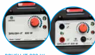
BRUSH IT 800 W ohne Beschriftungsfunktion