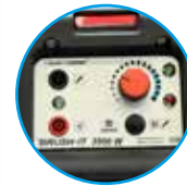
BRUSH IT 3500 W mit Beschriftungsfunktion