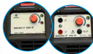
BRUSH IT 1500 W mit Beschriftungsfunktion