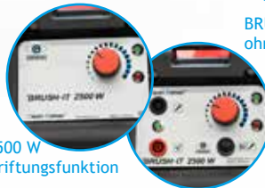
BRUSH IT 2500 W ohne Beschriftungsfunktion